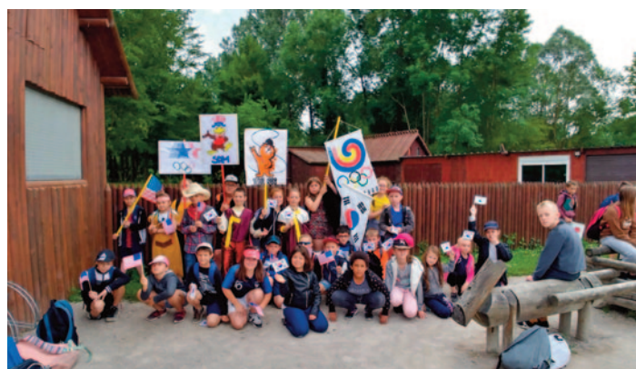
Les « olympiades » à Samara – 19 juin 2019

Les élèves, de la maternelle au CM2 ont participé aux rencontres USEP. Les classes de CE2, CM1 et CM2 ont participé à une rencontre « Pêche » ainsi qu'à une rencontre « Olympiades » pour les CM1 et CM2 à Samara.