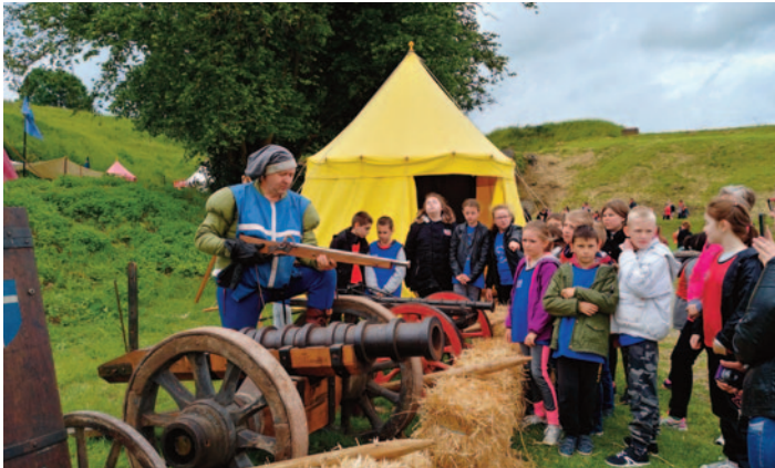
Les « Ducales de Guise » - Jeudi 13 juin 2019

Pour cette nouvelle année scolaire, de nombreux projets seront mis en place. Parmi ceux-ci :