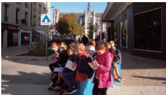
Découverte du centre-ville d'Amiens

Les trois classes de maternelle ont assisté au spectacle de marionnettes « Pierre et le loup » de la compagnie MARISKA suivi d'ateliers de fabrication de marionnettes.